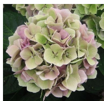
マジカルクリスタル