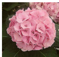
マジカルトパーズ