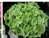
ピンクから緑へ 色が変わる！